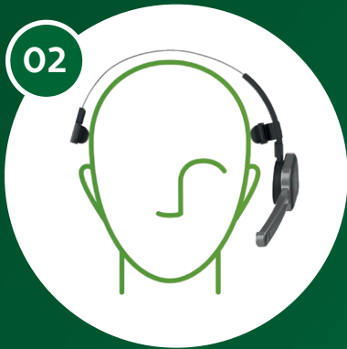
02 Oreille libre