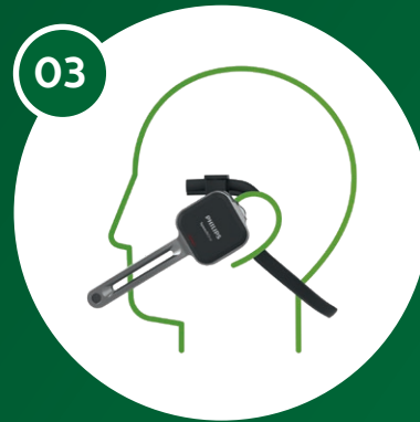
03 Tour de nuque